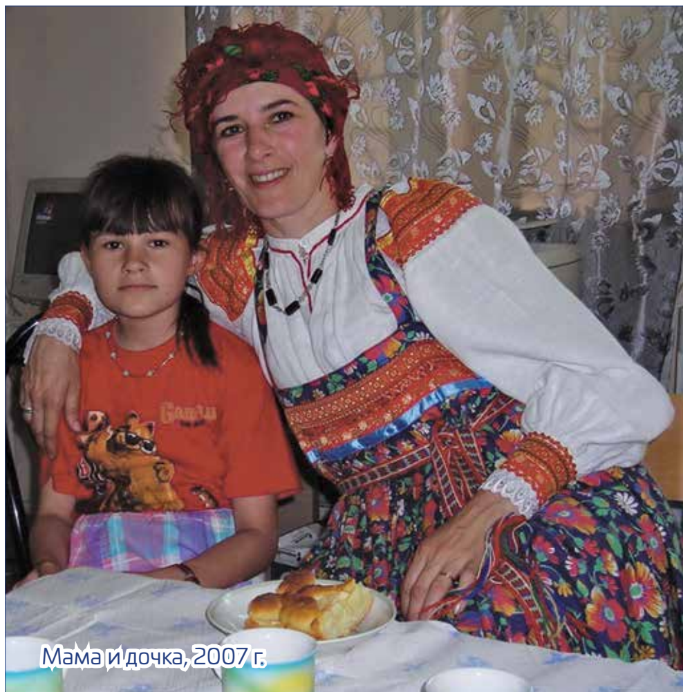
Мама и дочка, 2007 г.