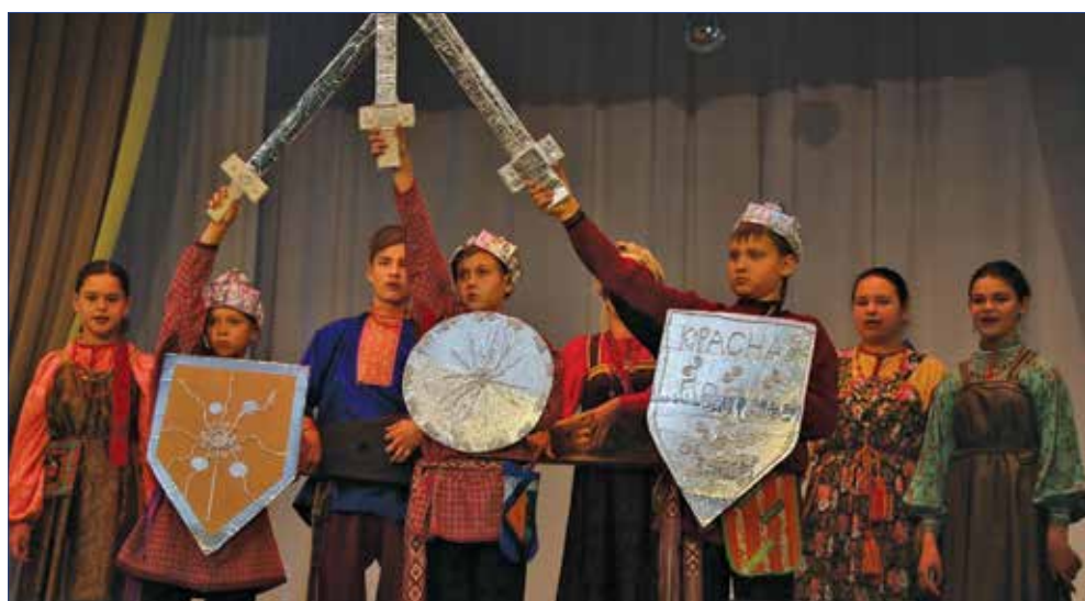
Конкурс чтецов во Дворце Творчества. Железногорск, 16.11.2019 г.