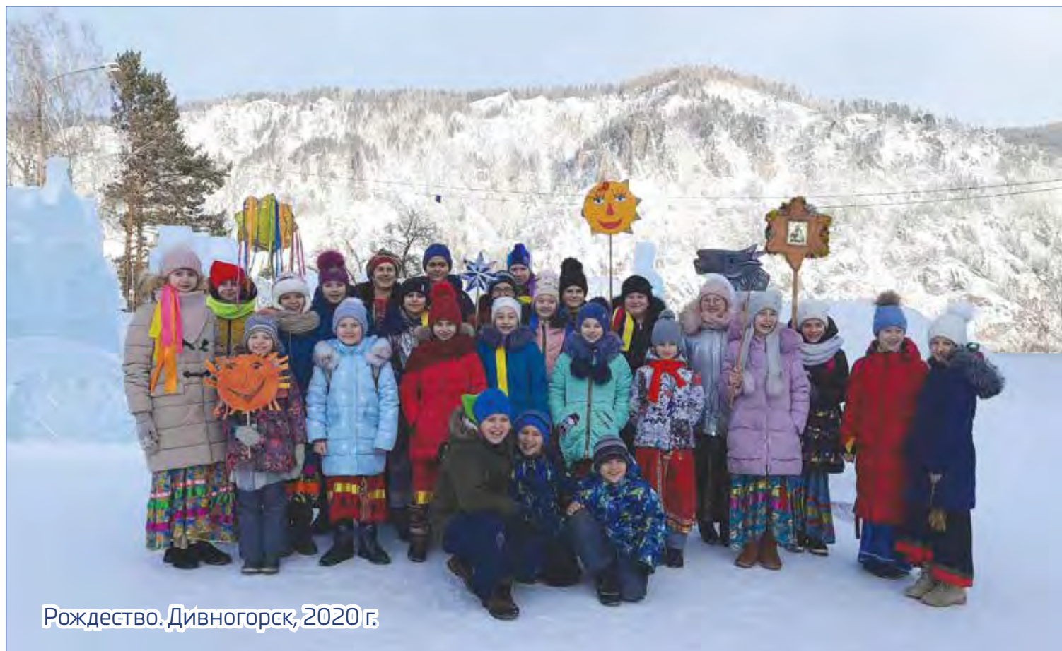
Рождество. Дивногорск, 2020 г.