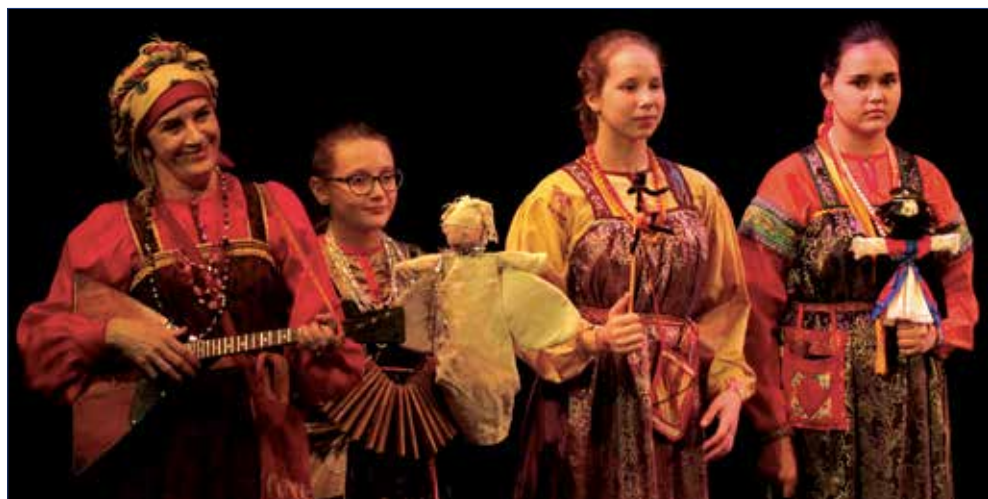
Выступление на фестивале-конкурсе «Надежда Мельпомены»