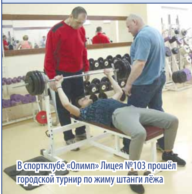
В спортклубе «Олимп» Лицея №103 прошёл городской турнир по жиму штанги лёжа