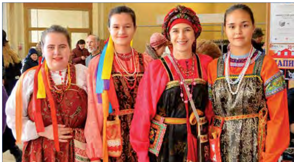
XXXVIII Сибирский фольклорный фестиваль. Новосибирск, 2019 г.