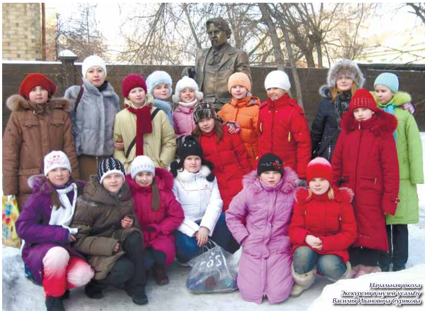
Начальная школа Экскурсия в музей-усадьбу Василия Ивановича Сурикова