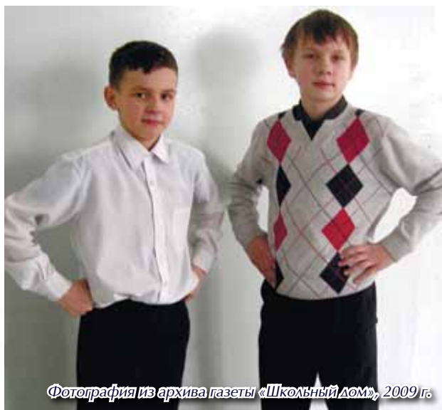
Фотография из архива газеты «Школьный Дом», 2009 г.

В Лицее #103 очень хорошо готовят к экзаменам. Этим он мне и нравится.