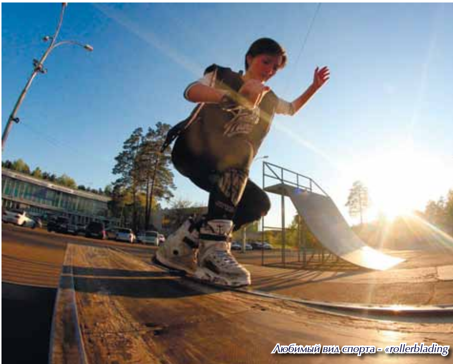
Любимый вид спорта - «rollerblading»

Нас постоянно настраивают на то, что у женщины должно быть хорошее образование. А кто детей будет воспитывать?