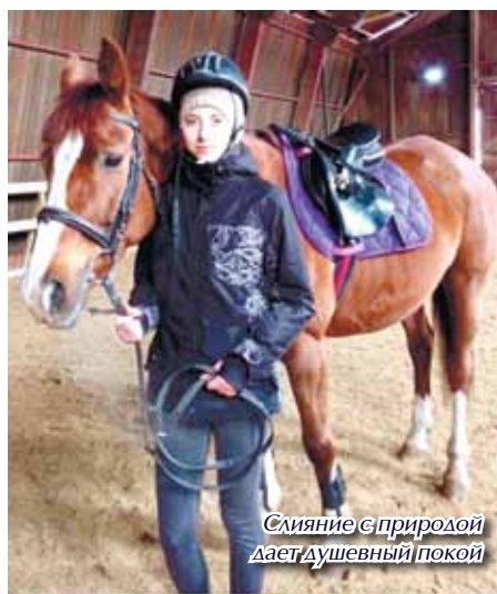
Слияние с природой даёт душевный покой