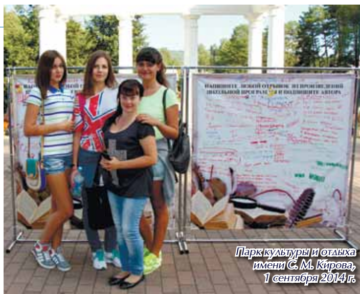
Парк культуры и отдыха имени С. М. Кирова, 1 сентября 2014 г.

Обещаю, что через двадцать лет буду отличным ветеринаром.