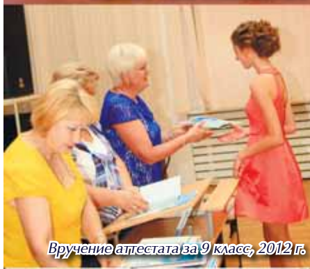
Вручение аттестата за 9 класс, 2012 г.