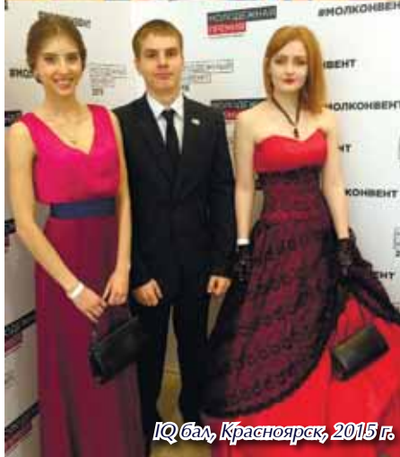
IQ бал, Красноярск, 2015 г.