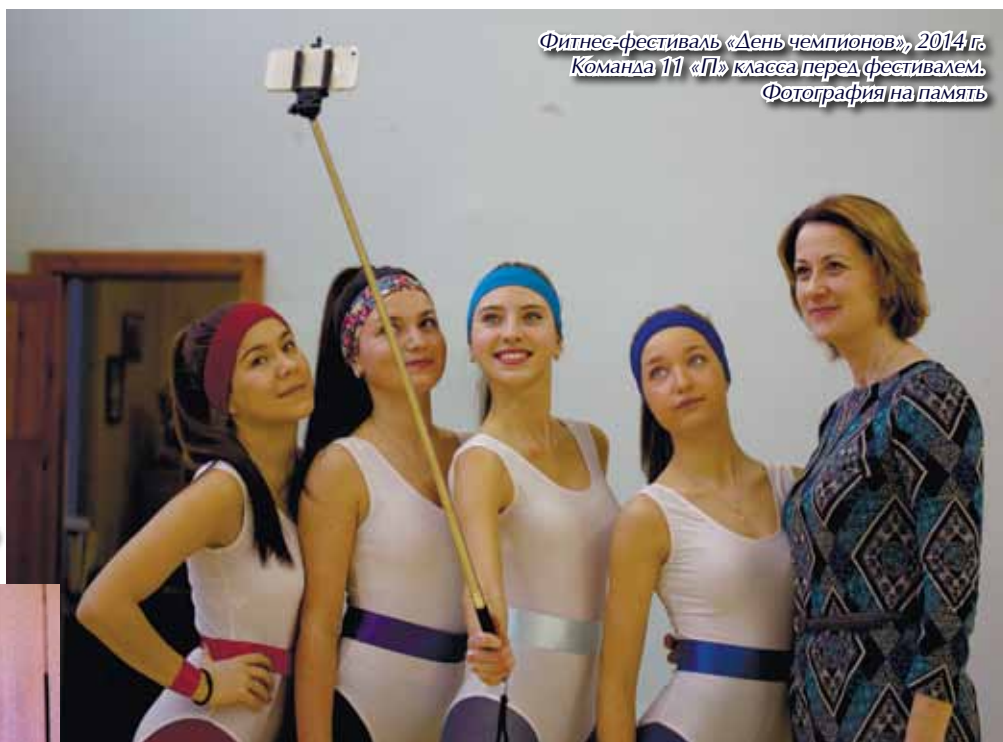
Фитнес-фестиваль «День чемпионов», 2014 г. Команда 11 «П» класса перед фестивалем. Фотография на память