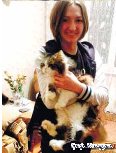
Граф. Кот друга.