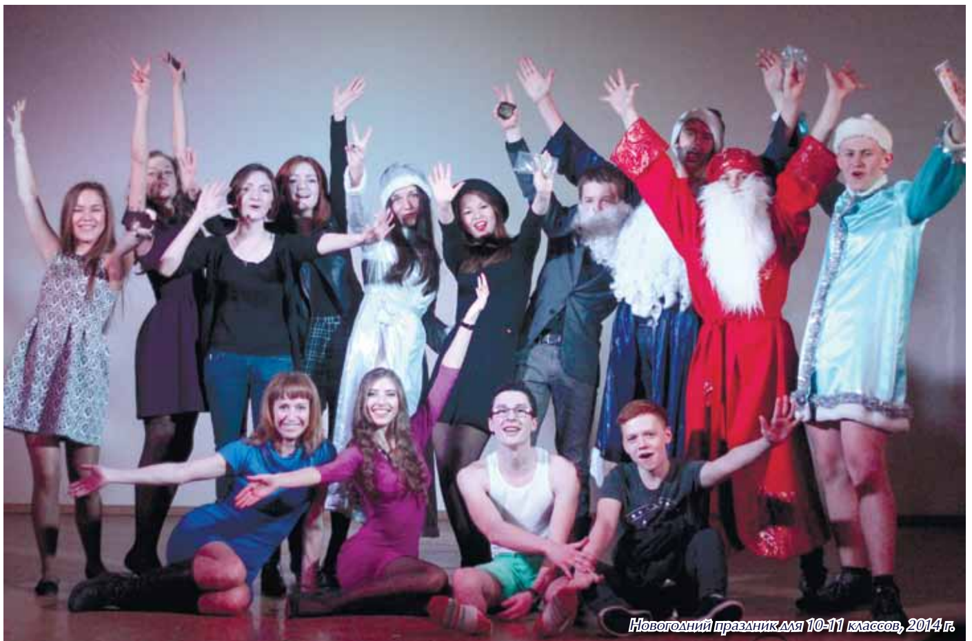
Новогодний праздник для 10-11 классов, 2014 г.

У нас получился настолько дружный класс, что никто никого не унижает. Бывают мелкие конфликты, но это редко. Мы ребята дружные, поэтому любим школу.