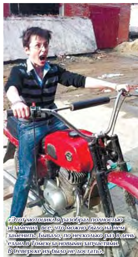
«Этот мотоцикл я разобрал полностью и заменил все, что можно было на нем заменить. Бывало, по несколько раз в день ездил в Томск за новыми запчастями. В Северске их было не достать».

- В Лицей №103 ты пришел сравнительно недавно – в восьмом классе. Из какого ты города?