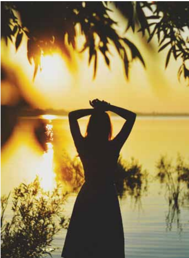
Валерия Убакова на закате