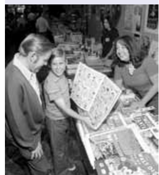
Comic Con, Сан Диего, 1975 г.

За более чем четыре десятилетия своего существования San Diego Comic-Con International стал одним из самых масштабных мероприятий своего рода.