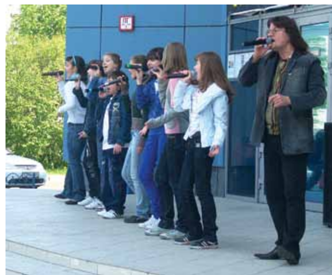
выступление в Железногорске перед зданием кинотеатра «Космос»