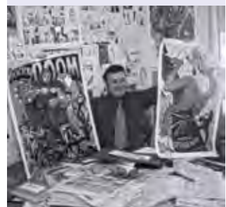
основатель Comic Con'a художник Шел Дорф, 1970 г.

Самый известный международный фестиваль. Основан в 1970 году художником Шелом Дорфом. Изначально задумывался как выставка комиксов, которая со временем расширялась, включая в себя и другие элементы поп-культуры: аниме, мангу, литературу ужасов, коллекционные карточные игры, видеоигры, фэнтези, научно-фантастические фильмы и литературу.